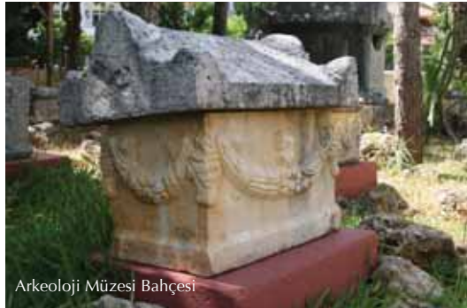
Arkeoloji Müzesi Bahçesi

Adını Kommagene Kralı Antiochos'un karısı lotape'den almış olan kent, Alanya'nın yaklaşık 30 km doğusundadır. Denize doğru uzanan bir tepe üzerinde kentin akropolü yer alır. Tepeye çıkılması oldukça zor olmakla birlikte sonunda izleyeceğiniz muhteşem manzara tüm yorgunluğunuzu unutturacak güzelliكتedir. Burayı görmeye geldiğinizde, kentin Akdeniz kıyısındaki konumu sayesinde, gizemli, arkeolojik bir tur gerçekleştirmenin yanında, antik limana ait kalıntıların bulunduğu koyda denize girme keyfini de yaşayabilirsiniz.