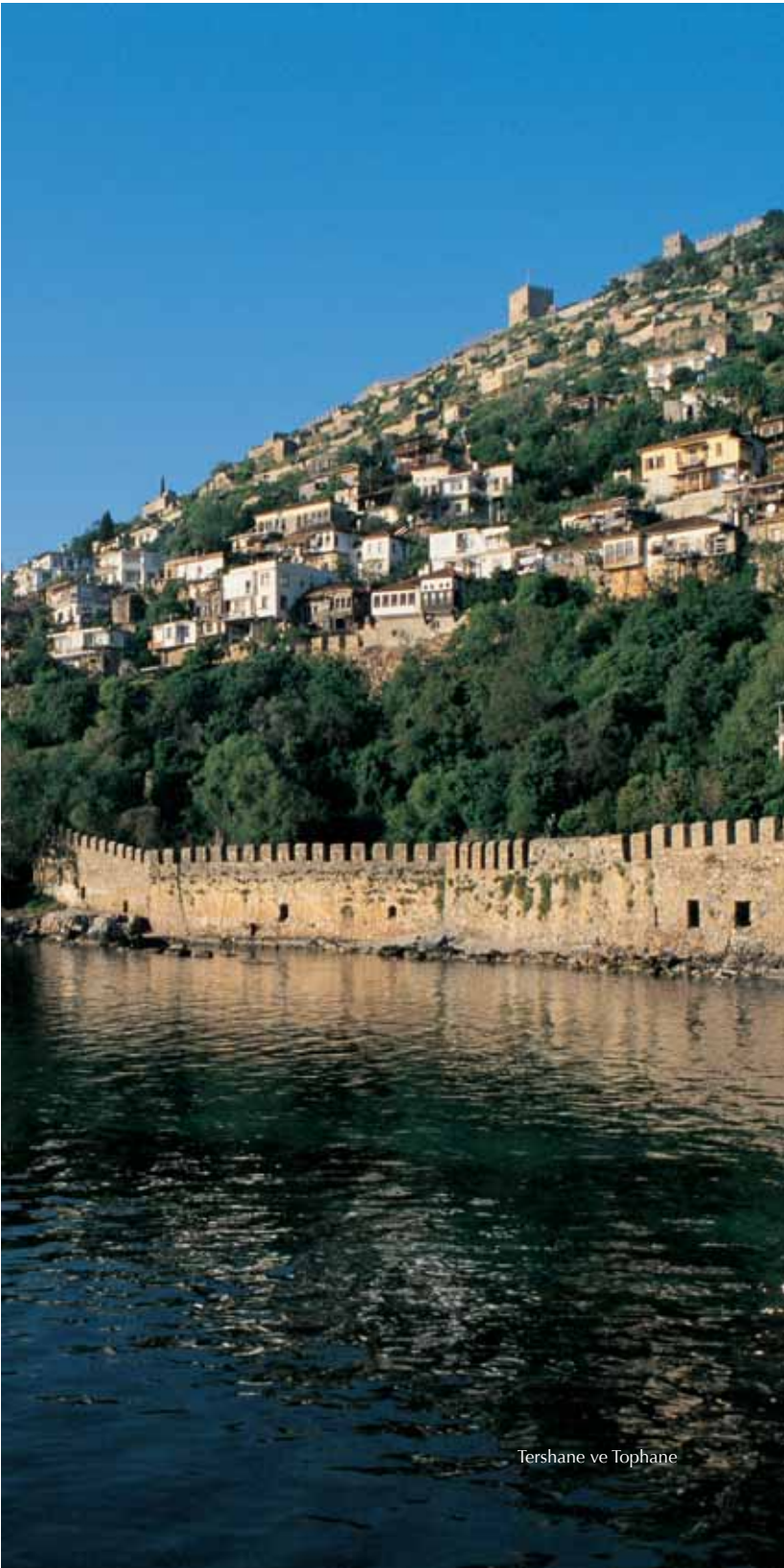
Tershane ve Tophane