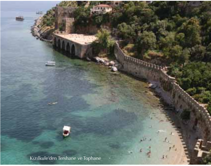
Kızılkule'den Tershane ve Tophane